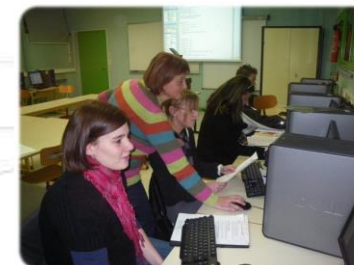
Etudiants de DCG2 en systèmes d'information de gestion

Formation comptable supérieure Licence - 180 crédits européens (ECTS)