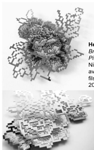
Heng LEE Broches brodées Pixel 3.5 et Pixel 4.5 Nickel plaqué argent avec platine, fils de soie colorés. 2013